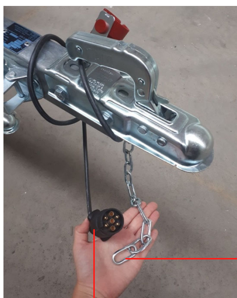
Prise électrique de la remorque du LiteXP